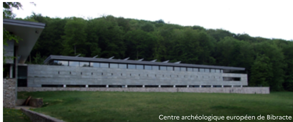
Centre archéologique européen de Bibracte

Scène nationale de Montbéliard (160 000 €)